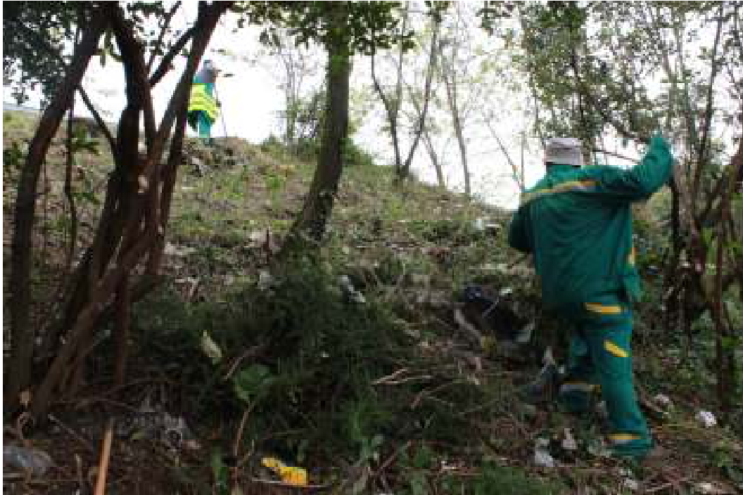
Slika 11. Čišćenje parka Orsula