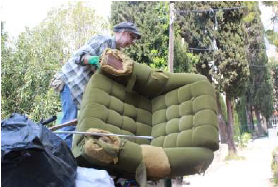
Slika 1. Čišćenje područja oko prostora Stare bolnice