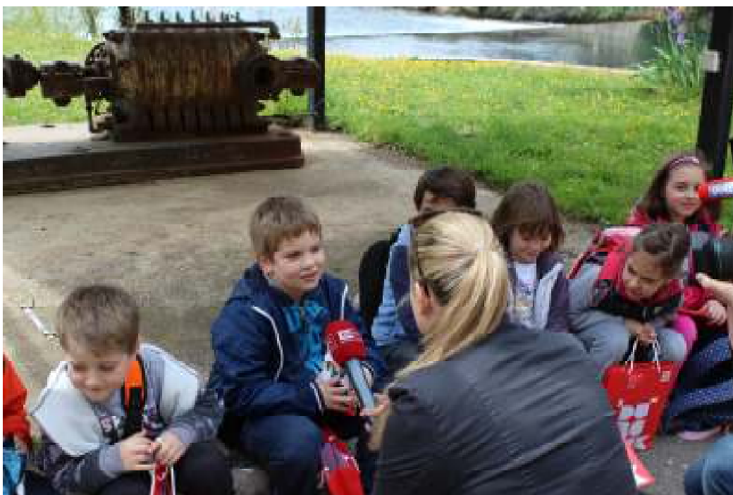
Slika 2. Edukacija povodom obilježavanja Svjetskog dana zaštite voda