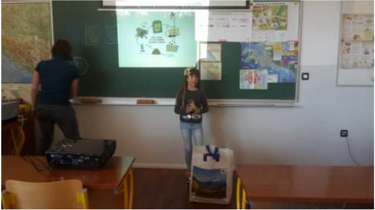
Slika 11. Edukacija udruge Deša kroz projekt „Klima ti i ja – pomози mami i recikliraj