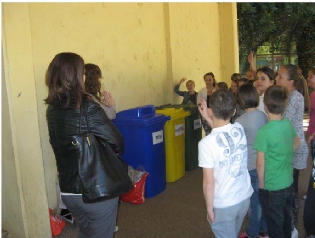
Slika 3. Edukacija o razvrstavanju otpada povodom obilježavanja Dana Planete zemlje