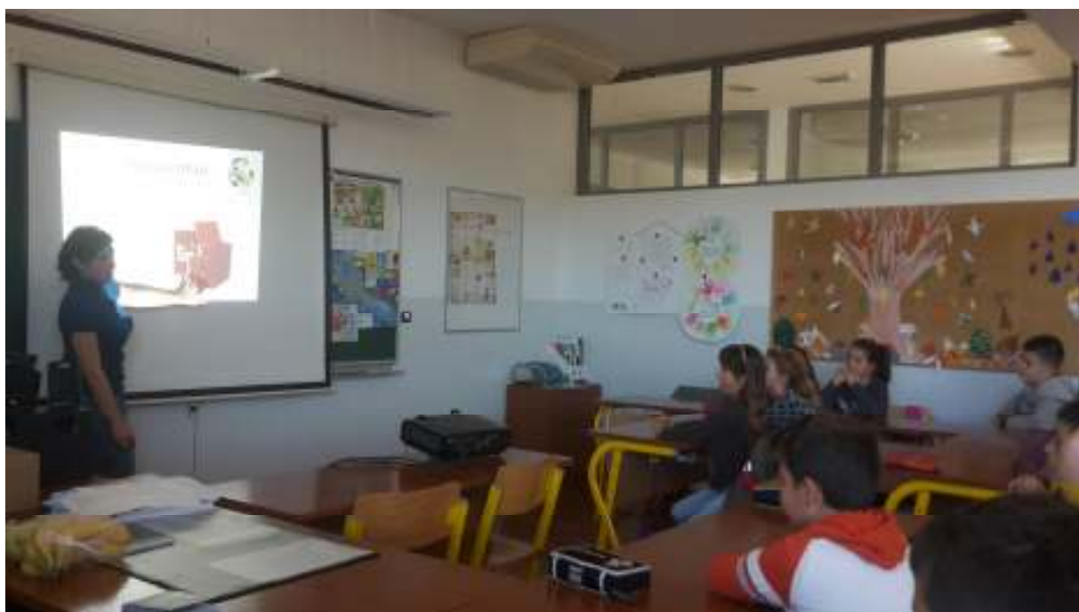
Slika 10. Edukacija udruge Deša kroz projekt „Klima ti i ja – pomози mami i recikliraj