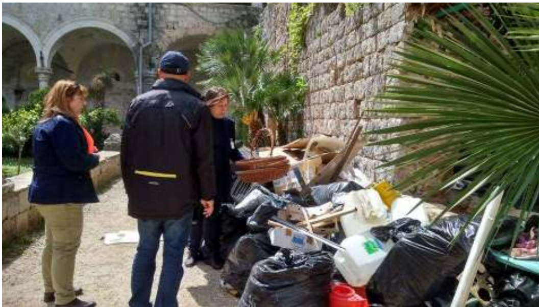
Slika 12. čišćenje otoka Lokum