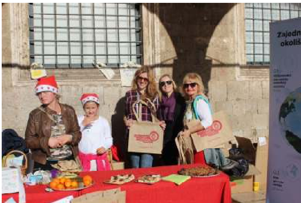
Slika 9. Obilježavanje Dana borbe protiv plastičnih vrećica