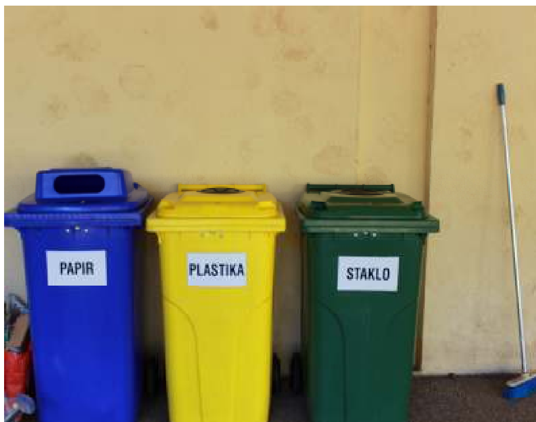
Slika 4. Edukacija o razvrstavanju otpada povodom obilježavanja Dana Planete zemlje