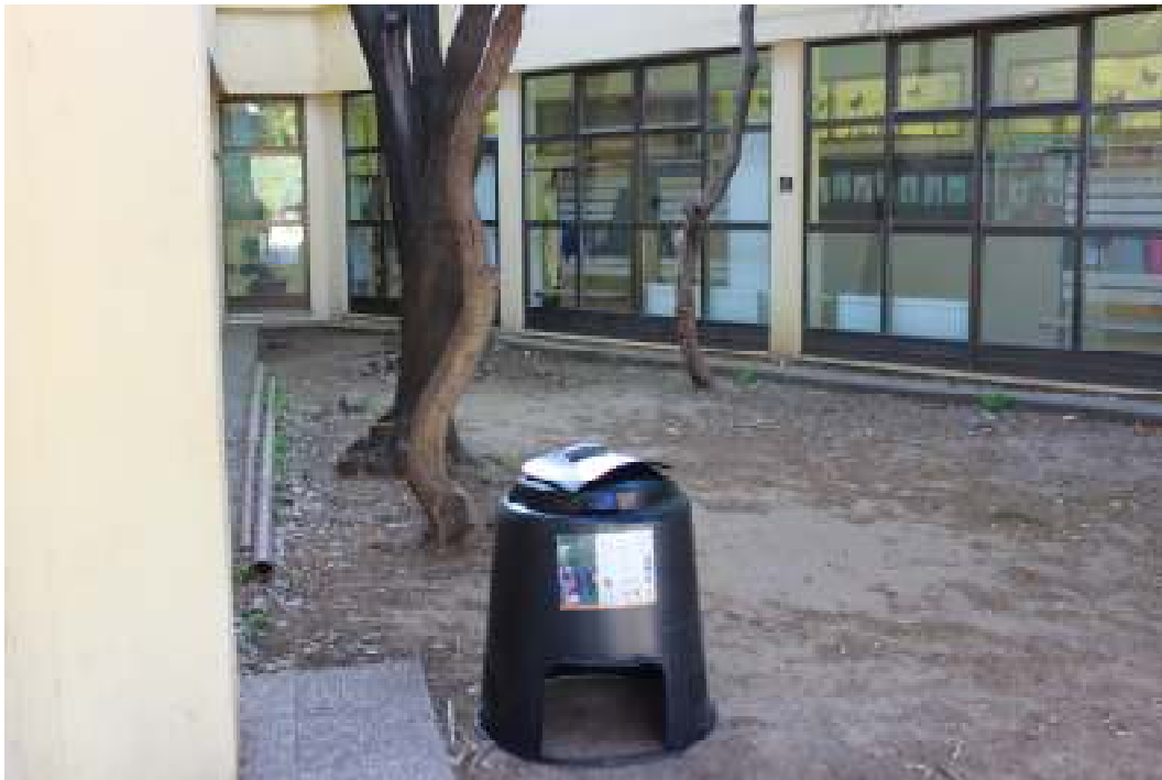
Slika 5. Edukacija o razvrstavanju otpada - biokompostana