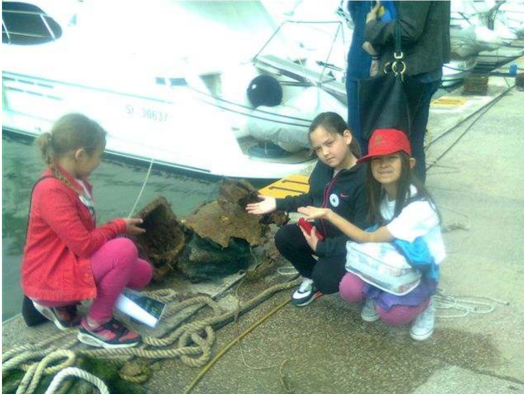
Slika 5. Čišćenje područja ACI marine u Rijeci Dubrovačkoj