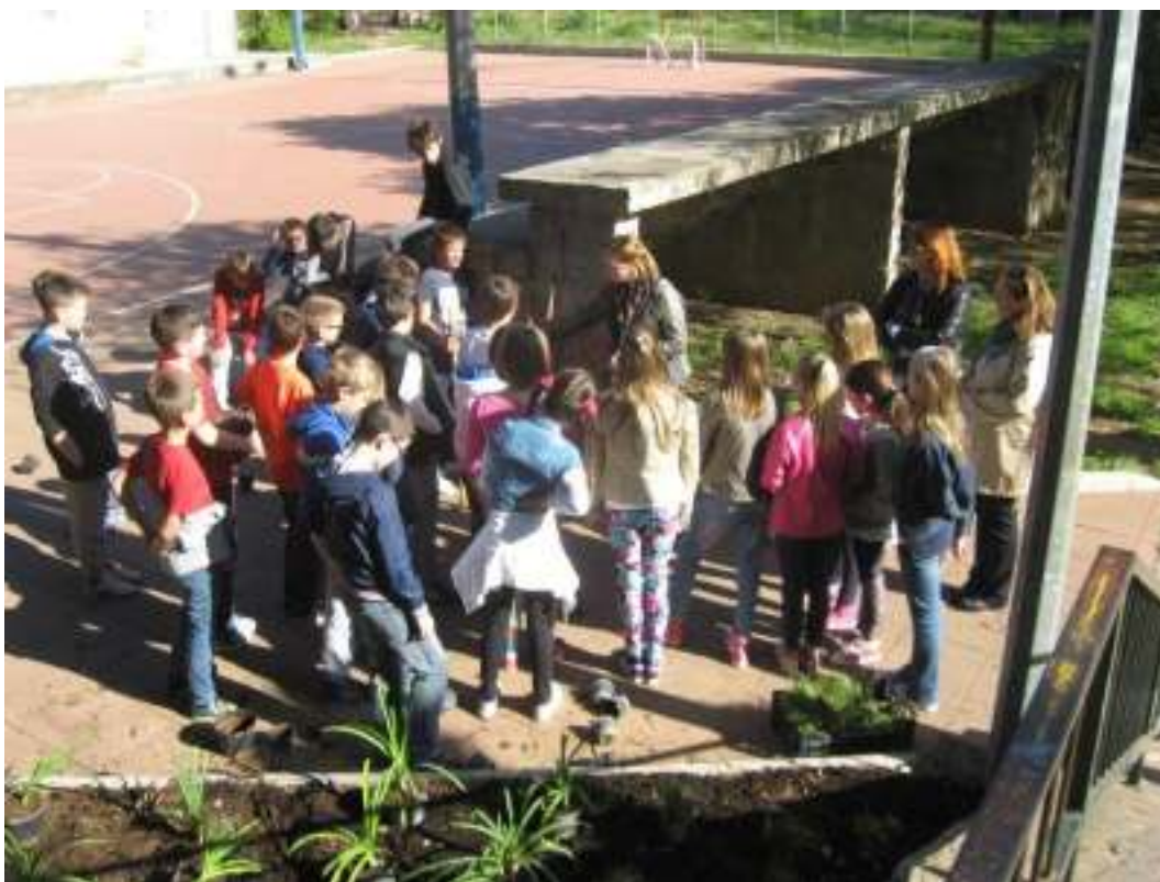
Slika 6. Edukacija povodom obilježavanja Dana Planete zemlj – uređenje okoliša i sadnja