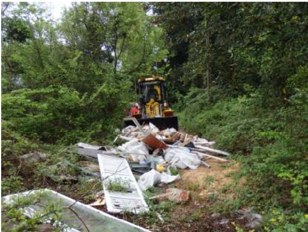
Slika 6. Čišćenje područja divljeg odlagališta u Komolac uz Jadransku cestu