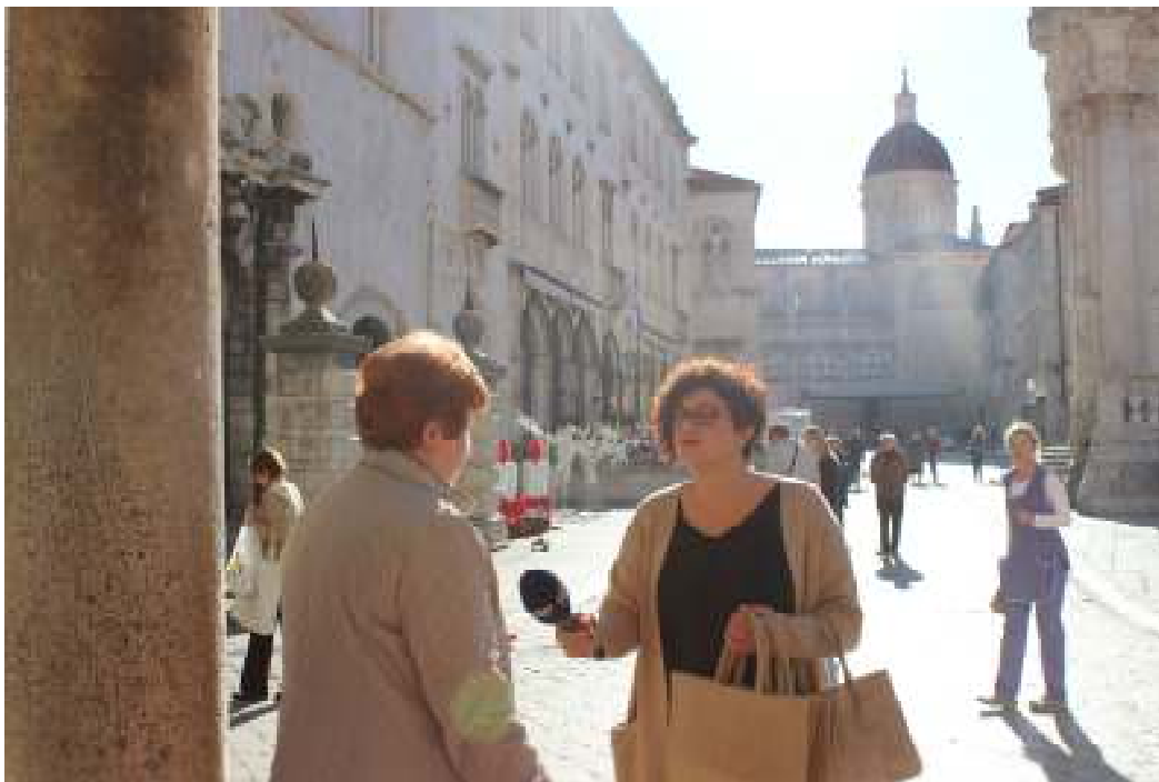
Slika 8. Obilježavanje Dana borbe protiv plastičnih vrećica