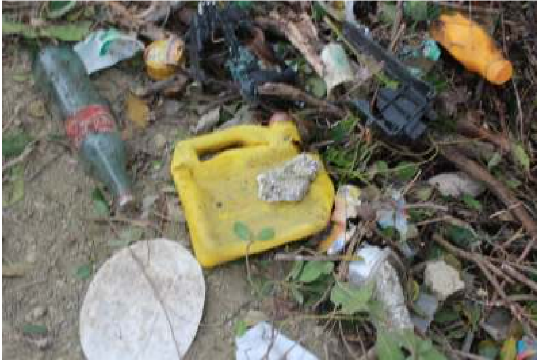
Slika 9. Čišćenje parka Orsula