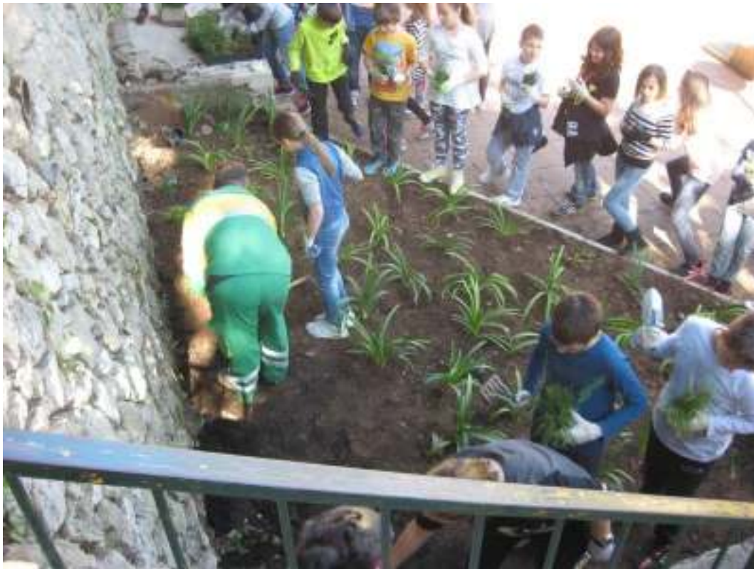
Slika 7. Edukacija povodom obilježavanja Dana Planete zemlj – uređenje okoliša i sadnja