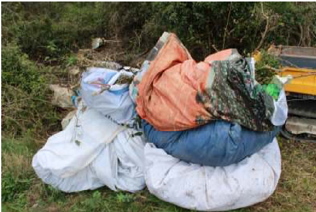
Slika 10. Čišćenje parka Orsula