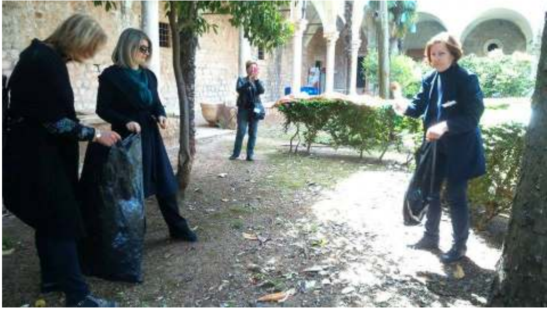
Slika 13. čišćenje otoka Lokum