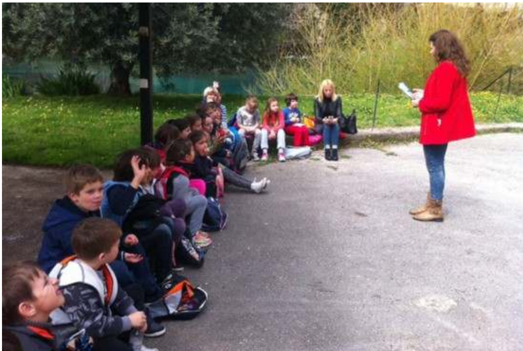
Slika 1. Edukacija povodom obilježavanja Svjetskog dana zaštite voda