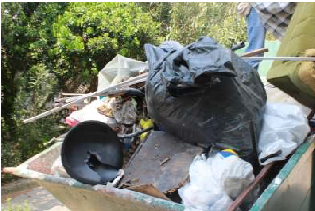
Slika 2. Čišćenje područja oko prostora Stare bolnice