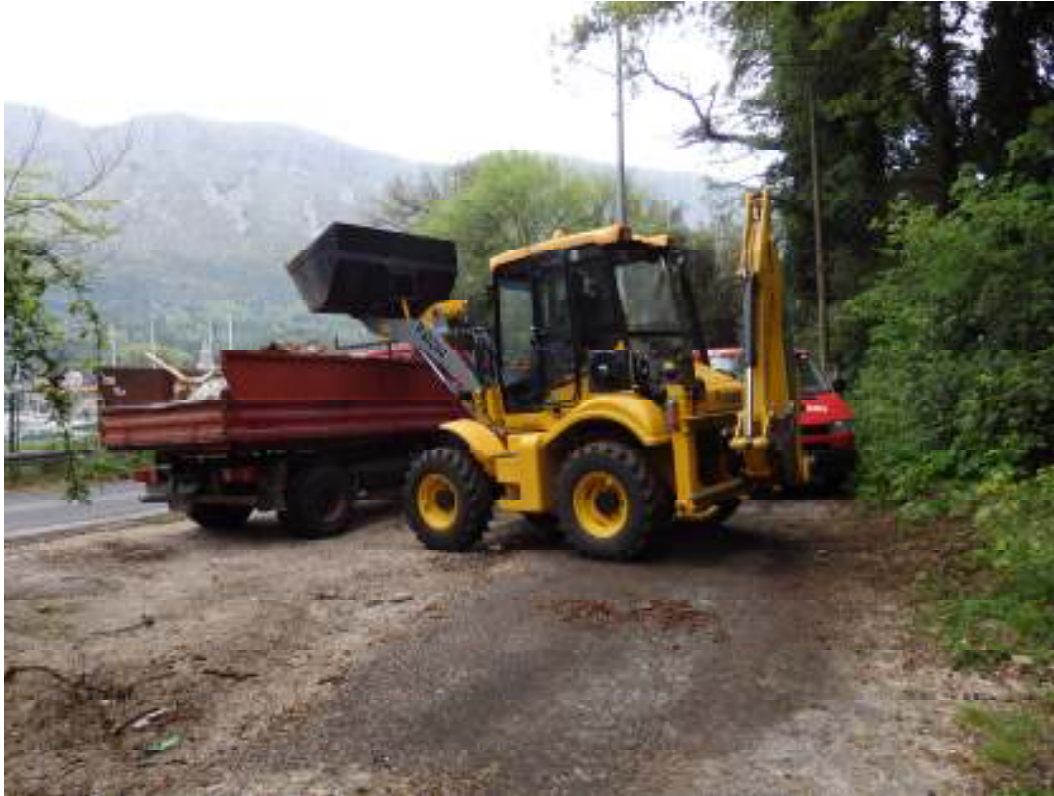
Slika 7. Čišćenje područja divljeg odlagališta u Komolac uz Jadransku cestu