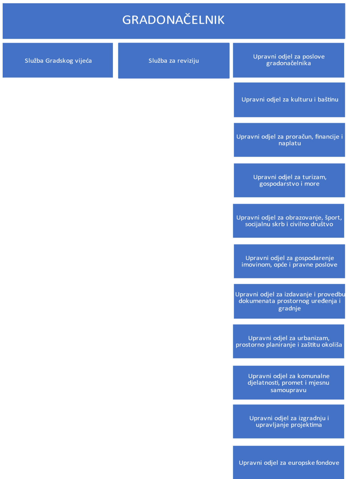
Slika 2: Organizacijska struktura Grada Dubrovnika