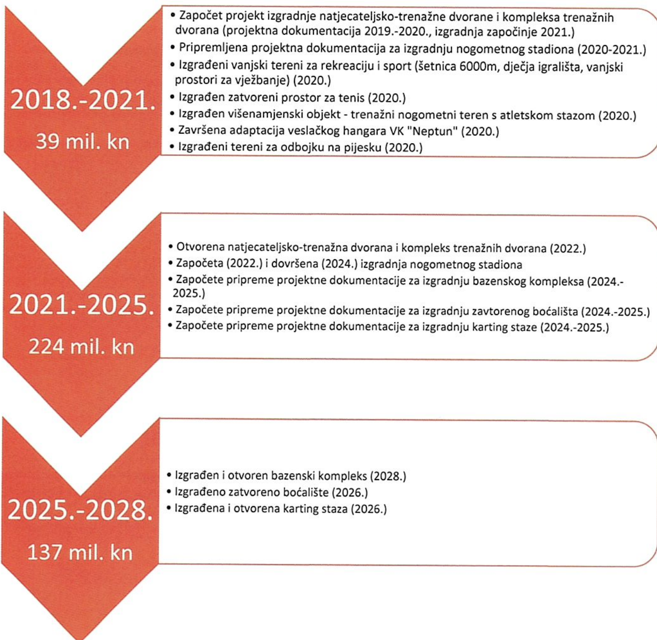
Graf 4.1.1. Vremenski slijed ključnih dijelova programskoga ostvarivanja strateških ciljeva