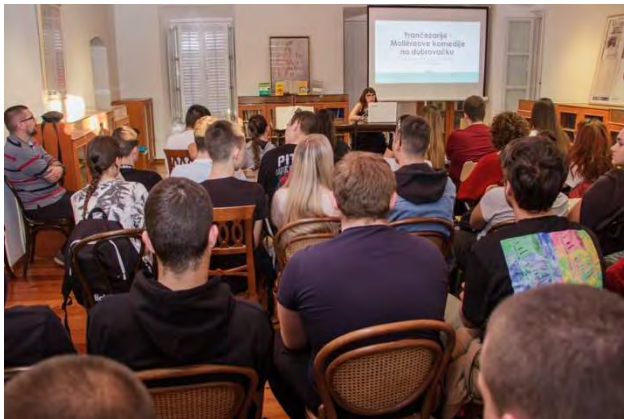
Predavanje na temu frančezarija u Znanstvenoj knjižnici Dubrovnik