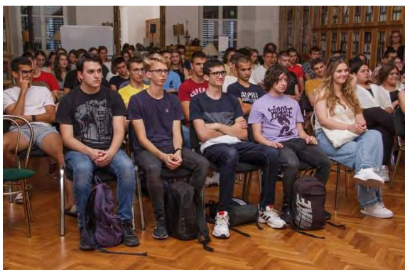
Učenici Pomorsko-tehničke škole, Ekonomske i trgovačke škole Dubrovnik, Gimnazije Dubrovnik te učenici Turističke i ugostiteljske škole Dubrovnik