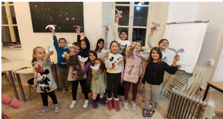
Djeca na završetku radionice

Povodom Feste sv. Vlahu, Odjel za djecu i mlade Dubrovačkih knjižnica organizirao je pričaonicu/radionicu "Naš parac". Na radionici se čitala slikovnica "Legenda o svetom Vlahu" Ivane Radaljic. Na poseban način djeca su imala priliku upoznati se s likom sv. Vlahu, upravo jer je slikovnica pisana glagoljičnim i latiničnim pismom. Nakon čitanja slikovnice, djeca su se kreativno izrazila izradom golubica od papira.