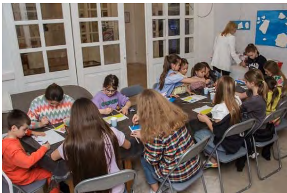
Na radionici djeca izrađuju ukrajinske zastave

Posljednji dan obilježavanja Noći knjige bio je namijenjen najmlađima.