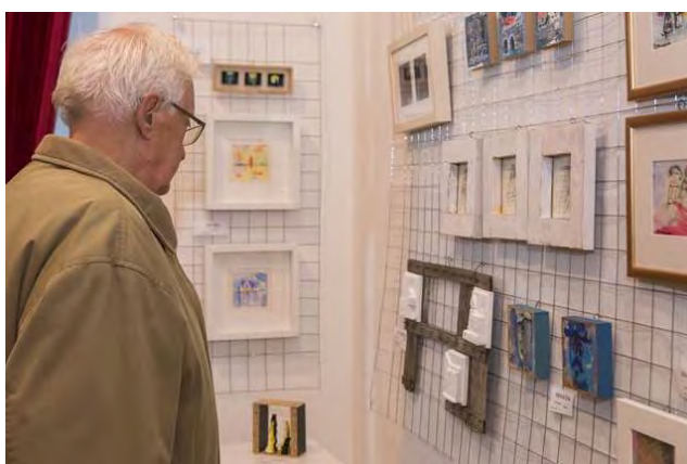
Međunarodni autori (70) Međunarodna izložba minijatura

Međunarodna izložba minijatura s preko 70 autora.