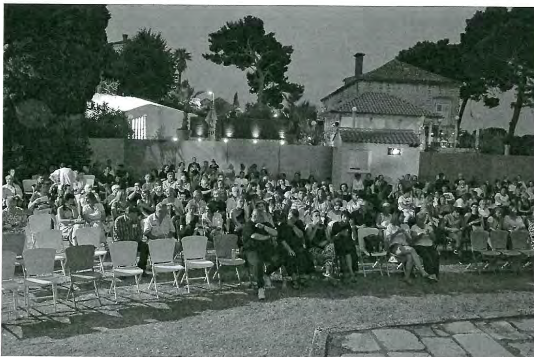
Kino Slavica pola sata prije premijere filma Baci se na pod 23.06.2022.

Uz navedene naslove, i u prošloj godini je redovan gost na našim pozornicama bila ekipa iz Splicke scene koja je svaki put napunila gledališta naših kako ljetnih kina, tako i zatvorenih dvorana.