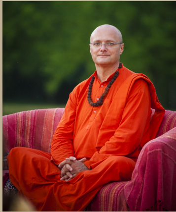
Swami Vivek Puri