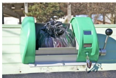
(Stilizirani izgled otpadomjera).

Dodatni trošak održavanja tijekom perioda eksploatacije.