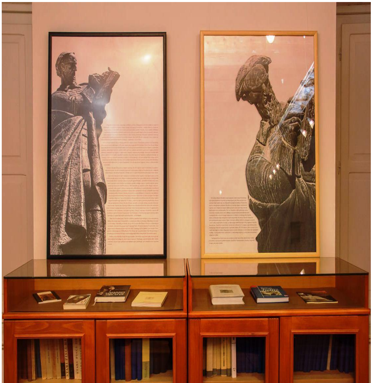
500. obljetnica tiskanja Marulićeve Judite