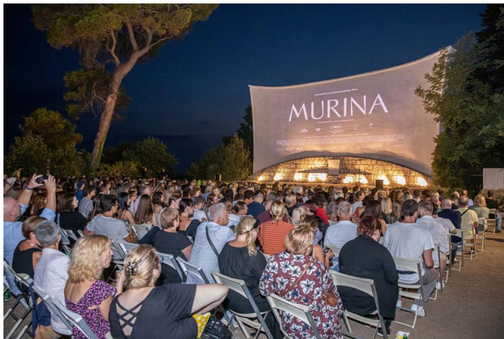
Prepunno kino Slavica (420 posjetitelja) na svečanoj projekciji filma Murina 24.08.2021.