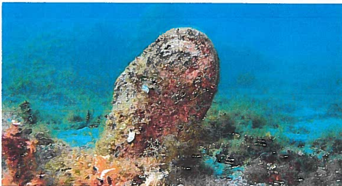
Ugrožena vrta Periska, Palastura (lat. Pinna nobilis )

U svrhu donošenja ove Odluke, sukladno odredbi članka 66. stavka 1. Zakona o zaštiti okoliša („Narodne novine“, broj: 80/13, 153/13, 78/15, 12/18, 118/18) u svezi odredbe članka 86. stavka 3. Zakona, pribavljeno je mišljenje Upravnog odjela za zaštitu okoliša i komunalne poslove Dubrovačko-neretvanske županije KLASA: 351-01/21-01/74, URBROJ: 2117/1-09/2-21-02 od 17. rujna 2021. o potrebi provedbe postupka ocjene, odnosno strateške procjene utjecaja Plana na okoliš, prema kojem je za izradu Plana obvezna provedba postupka strateške procjene utjecaja na okoliš. U navedenom mišljenju je također navedeno kako je prije započinjanja postupka strateške procjene, sukladno članku 48. Zakona o zaštiti prirode („Narodne novine“, broj: 80/13, 15/18, 14/19 i 127/19) potrebno podnijeti zahtjev za prethodnu ocjenu prihvatljivosti Plana na ekološku mrežu. Predmetni postupak je proveden te je Dubrovačko-neretvanska županija, Upravni odjel za zaštitu okoliša i komunalne poslove 22. prosinca 2021. donijela Rješenje KLASA: UP/I-612-07/21-01/22, URBROJ: 2117/1-09/2-21-07 da je Urbanistički plan uređenja „Zaton Mali I na predjelu Bunica“ prihvatljiv za ekološku mrežu te da nije potrebno provesti glavnu ocjenu prihvatljivosti Plana na ekološku mrežu.