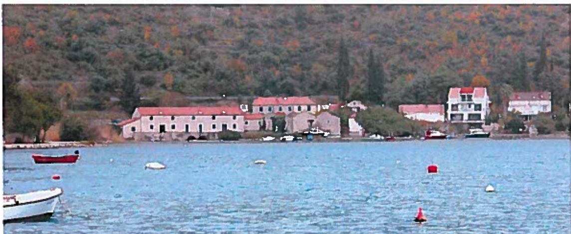
Predio uz izvorište Palata