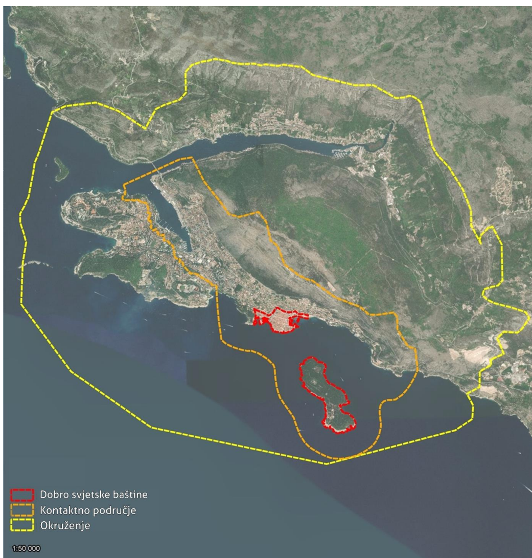
Slika 1. Prostorna pokrivenost područja svjetskog dobra, kontaktne zone i okruženja