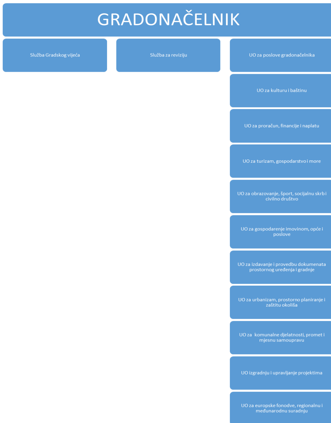
Slika 2: Organizacijska struktura Grada Dubrovnika