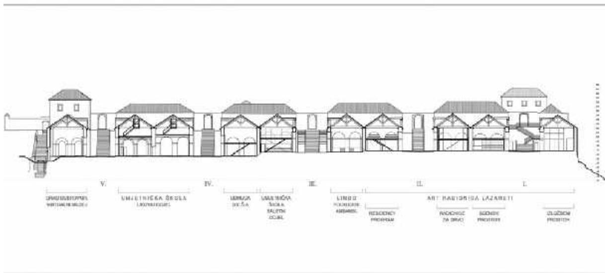
Slika bočnog presjeka Lazareta iz 2013. godine, autora dr.sc. Željka Pekovića, s ucrtanom namjenom kakva je tada bila planirana. 2

Karantenski sklop Lazareta smješten je na Pločama, na istočnoj strani dubrovačke gradske jezgre. Postavljen je tako da čini bitan dio urbanističkog sklopa gradske luke s okolnim utverdama, a predstavlja jedan od najznačajnijih spomenika zdravstvene kulture u Republici Hrvatskoj (sredinom 14. stoljeća donesena prva odluka o utemeljenju karantene u povijesti europskog zdravstva vjerojatno potaknuta pandemijom kuge). Jedna je od rijetkih potpuno sačuvanih karantenskih građevina i jedina je takva na europskom dijelu Mediterana. To je jednostavna građevina, visoka jednu etažu, a duga preko sto metara i izvana donekle sličgi gradskim zidinama. Sklop Lazareta sastoji se od pet jednako organiziranih odjeljenja od po dvije zgrade i dvorišta među njima, tj. od deset dvorana (lađa) između kojih se nalazi pet unutarnjih dvorišta (tzv. badžafera), s dvjema kućicama na kat na ulazu i kraju lazareta. Pri tom su tri istočna odjeljenja nešto duža od ostalih. Svako od njih podijeljeno je u tri dijela koje se sastoji od dvorišta i dvije izdužene pravokutne lađe. Sa sjeverne strane je visok ogradni zid, a s južne se pruža niz manjih zgrada (Baće i Viđen, 2013).