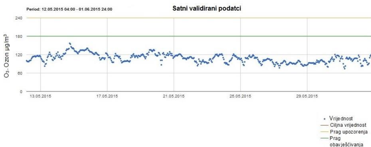
Slika 8.3.-1.: Prikaz satnih validiranih podataka sa mjerne postaje Žarkovica za prvih 6 mjeseci 2015. godine

Primjer prikaza satnih validiranih podataka sa mjerne postaje Žarkovica vidljiv je na slici 8.3.-1.