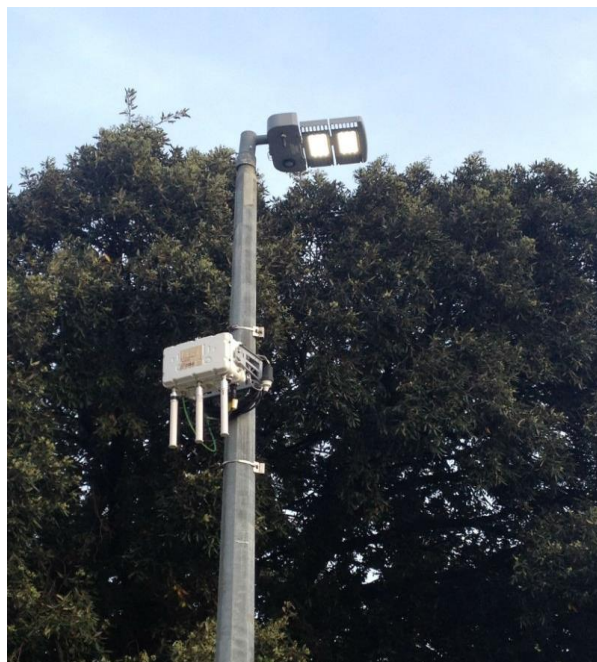
Slika 4.2.3.-1.: „Pametna svjetiljka“ sa sensorima u parku Luja Šoletića

Projektom Smart City u Dubrovniku planirano je postavljanje mnogobrojnih senzora koji će pratiti kakvoću zraka i druge parametre koji utječu na okoliš.