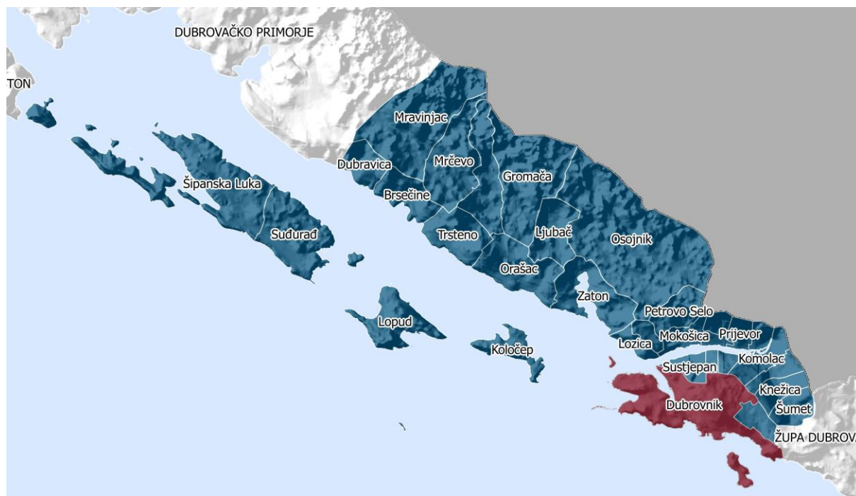
Slika 2.1-1 Teritorijalni ustroj Grada Dubrovnik s pripadajućim naseljima (plavo - seoska, crveno - gradsko) i položaj u odnosu na susjedne JLS - Općine Dubrovačko Primorje i Župa Dubrovačka

Sastav Grada Dubrovnik čine 32 naselja 1 (Slika 2.1-1): Bosanka, Brsečine, Čajkovića, Čajkovići, Donje Obuljeno, Dubravica, Dubrovnik, Gornje Obuljeno, Gromača, Kliševo, Knežica, Koločep, Komolac, Lopud, Lozica, Ljubač, Mokošica, Mravinjac, Mrčevo, Nova Mokošica, Orašac, Osojnik, Petrovo Selo, Pobrežje, Prijevor, Rožat, Suđurađ, Sustjepan, Šipanska Luka, Šumet, Trsteno i Zaton. Prema zadnjem aktualnom Popisu stanovništva, kućanstava i stanova iz 2011. godine (DZS, 2011.), Grad broji ukupno 42.641 stalnih stanovnika.